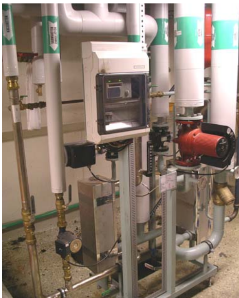
Inkoppling av fjärrvärme istället för spädvatten

Oljepannornas konservering har byggts om från konservering med ånga till cirkulerande varmt fjärrvärmevatten, vilket sparar energi eftersom elpannan inte behöver vara i drift för att producera ånga.