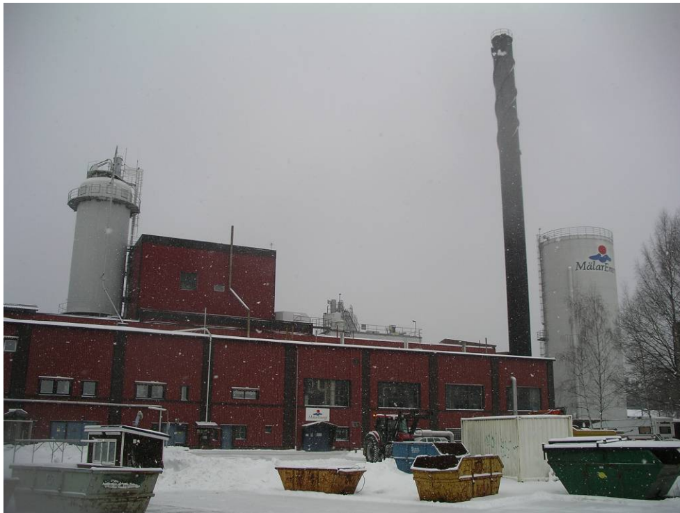
Hetvattencentralen i Hallstahammar, vy från söder

HVC (hetvattencentralen) och distributionsnätet för fjärrvärme i Hallstahammar samt oljepannor i Kolbäck ägs av Mälarenergi AB.