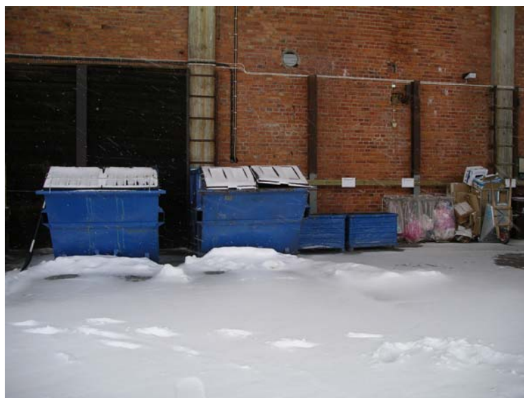
Station för källsortering. På bilden har snö blåst in under taket p g a kraftig vind.

Sorteringen sker i brännbart och restavfall, mjuk plast, wellpapp, papper m m. Under normal drift uppstår inga större mängder avfall. Alla behållare står under tak.