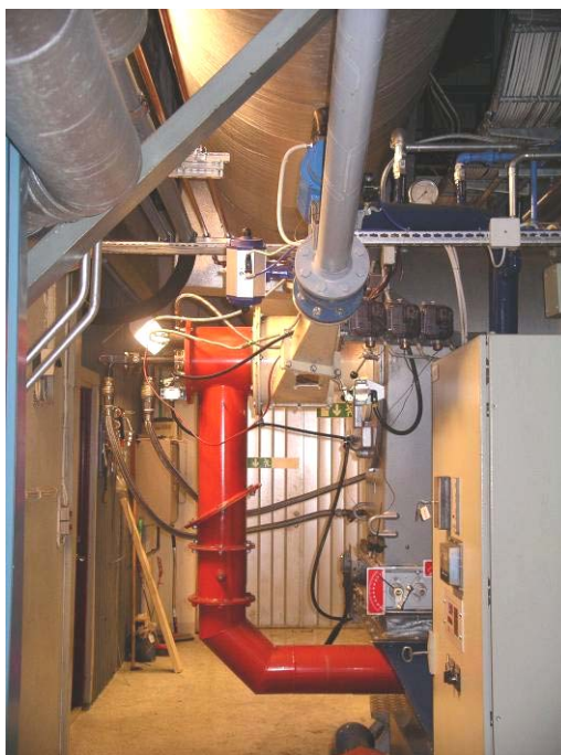
Pulverbrännaren på Panna 1

Vid träpulvereldning i Panna 1 leds rökgaserna efter cyklon via Panna 5:s elfilter för rening av stoft och därefter genom Panna 5:s skorsten.